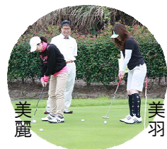
練習グリーンでパットの練習

朝夕めっきり寒くなり、秋を感じる今日この頃になりました。皆さん、いかがお過ごしですか？ 私たち二人にはこれといった変化もなく、相変わらず平穏な日々を送っています。