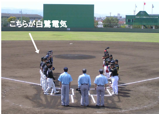
こちらが白鷺電気