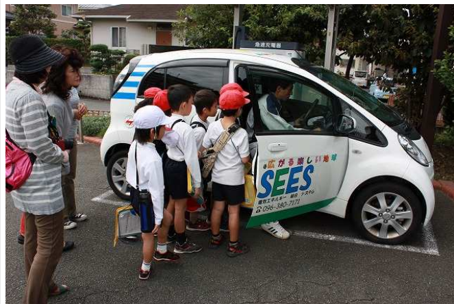
電気自動車に興味津々

小学生の皆さんから、 ・働いていて嬉しいことは何ですか。 ・働いている人は何人ですか。 ・どういった機械がありますか。 ・一番売れているものは何ですか。 ・お客さんは何人ぐらいきますか。 など、いろいろ質問をうけました。担当者も分かり易いように質問に答えていました。 質問が終わり、屋上緑化や太陽光